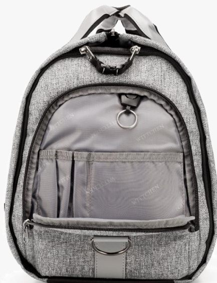
Torba na garnitur 56-3S-700-*

Cena detaliczna sklep Wittchen: 349 brutto, *napisz do nas, aby uzyskać atrakcyjny rabat: b2b@wittchen.com